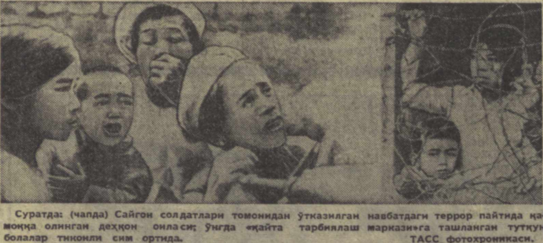
Суратда: (чапда) Сайгон солдатлари томонидан ўтказилган навбатдаги террор пайтида қомонда олинган дехқон оиласи; ўртада «Япайта тарбиялаш марказига» ташланган туғтун болалар тинимли сими ортида.