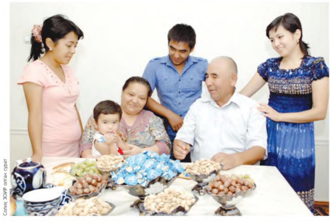
Солдан ўнггача: ота-она билан болалар