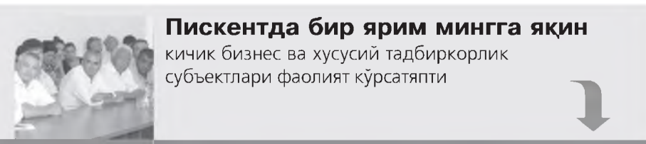
Пискентда бир ярим мингга яқин кичик бизнес ва хусусий тадбиркорлик субъектлари фаолият кўрсатяпти