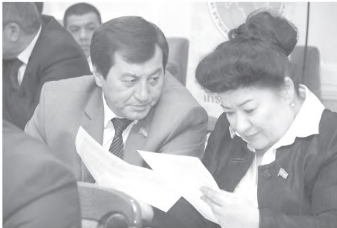
Давоми. Бошланиши 1-саҳифада ◀◀