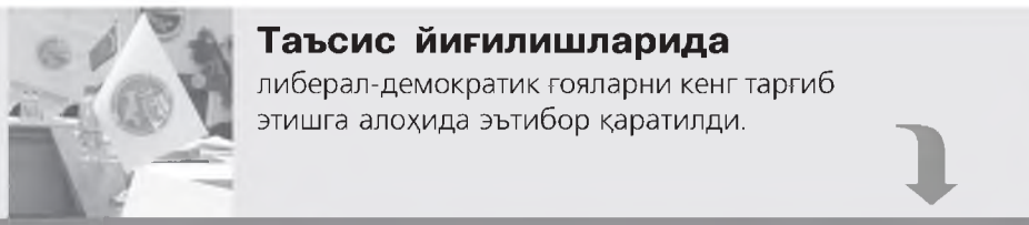
Таъсис йиғилишларида либерал-демократик гояларни кенг тарғиб этишга алоҳида эътибор қаратилди.