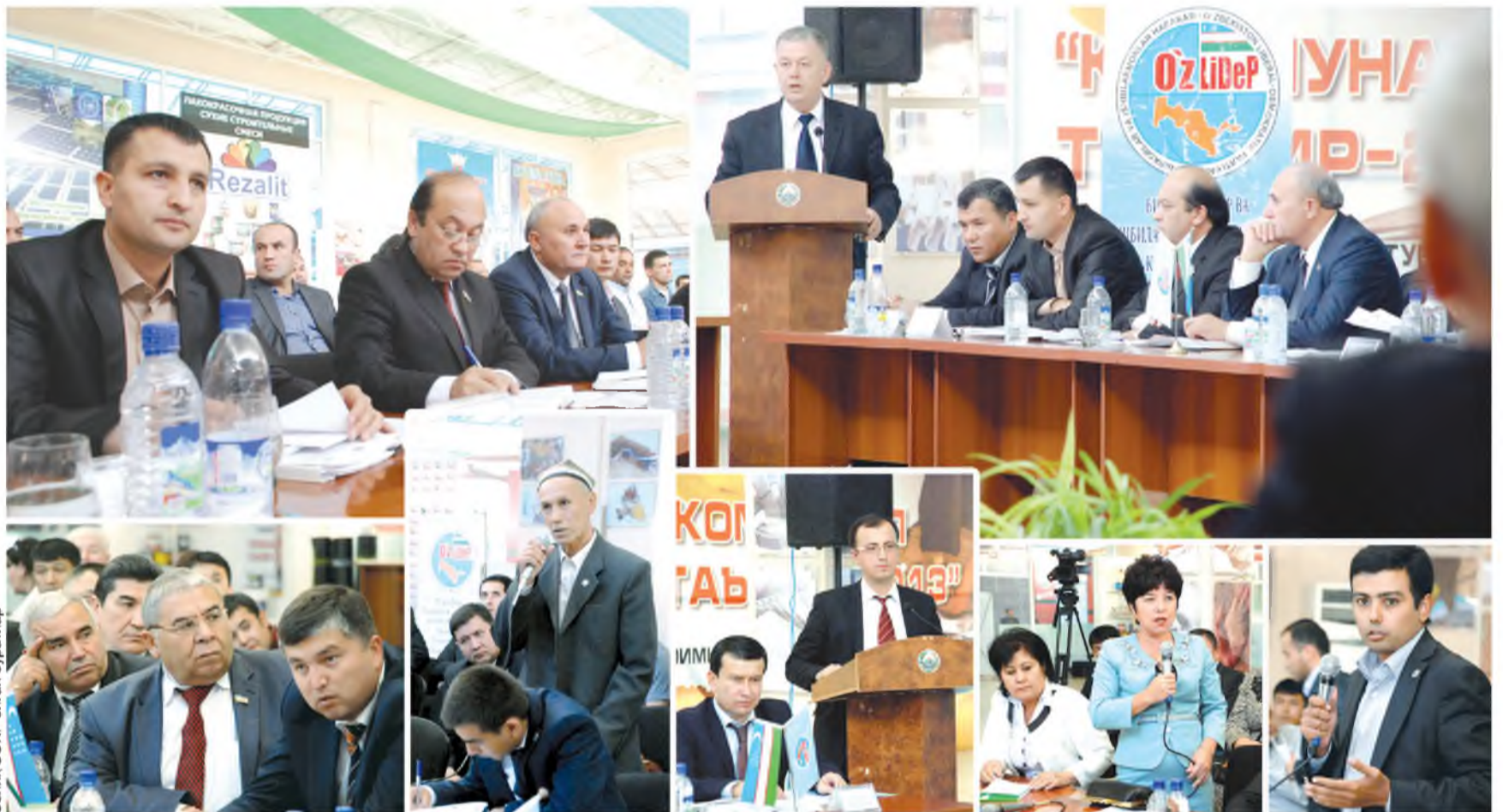
Солққ. ЗОИР олган суратлар

Энг муҳими, янги қонун асосида тadbirkorлик субъектлари ҳуқуқларининг устуворлиги принципи барча қонунларга киритилмоқда.