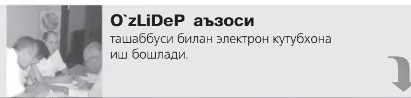
O'zLiDeP аъзоси ташаббуси билан электрон кутубхона иш бошлади.