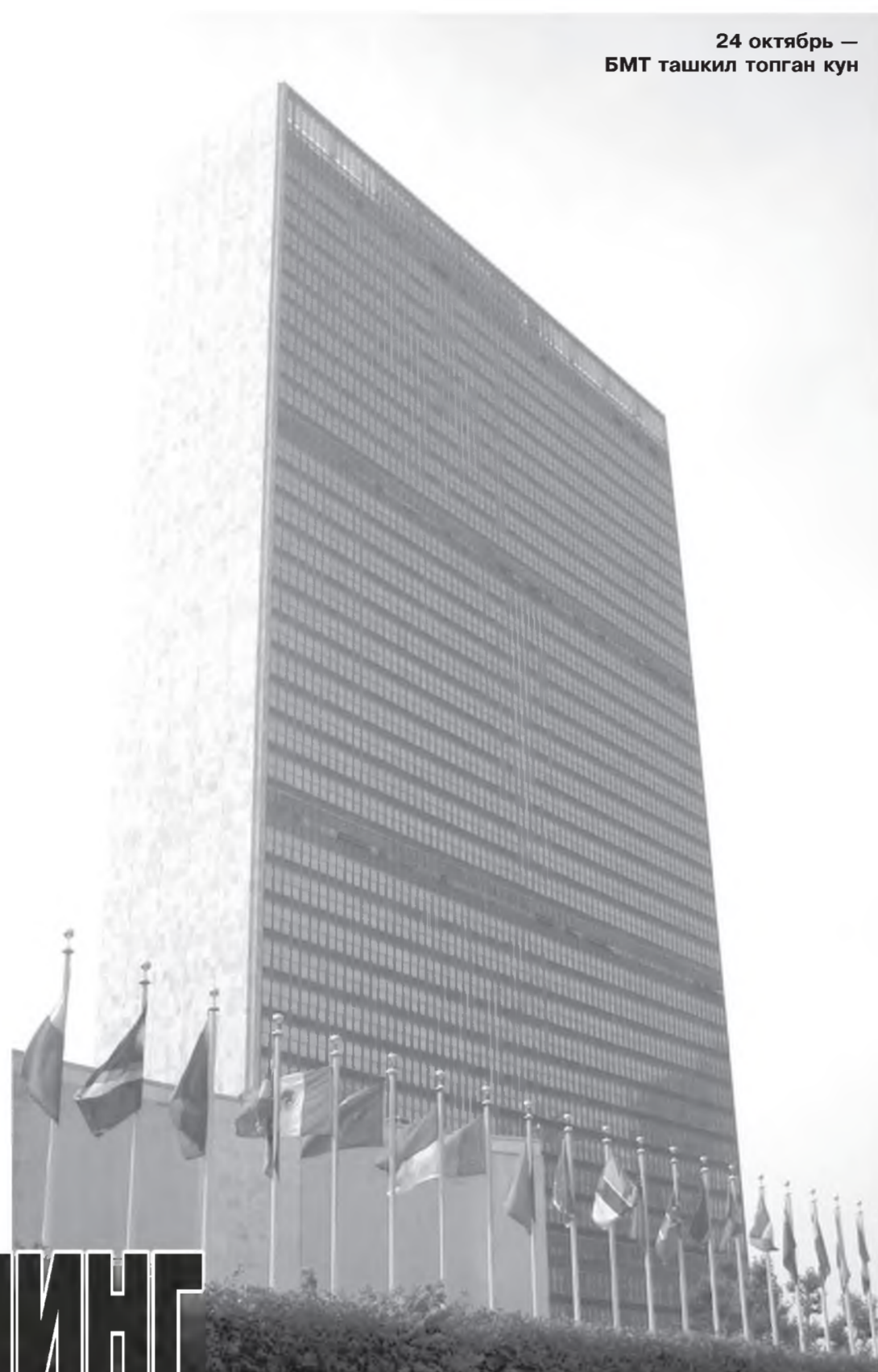
24 октябрь — БМТ ташкил топган кун

Ўзбекистон тинчлик ва барқарорликни мустаҳкамлаш, экологик муаммоларни бартараф этиш, ижтимоий-иқтисодий ривожланиш борасида БМТ билан изчил ҳамкорлик қилиб келмоқда. Мамлакатимиз халқаро миқёсдаги асосли ва эзгу ташаббуслари билан жаҳон ҳамжамияти хурматини қозонмоқда. Президентимизнинг Афғонис-