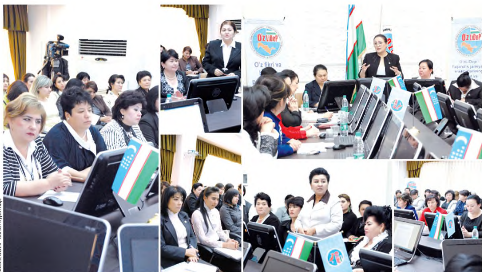
Солмак ЗОИР олган суратлар