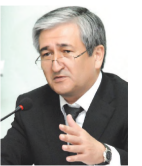
Анвар АЛИМОВ, Ўзбекистон Республикаси соғлиқни сақлаш вазири

— «Соғлом бола йили» Давлат дастурида белгилаб берилган устувор йўналишлар асосида бу йил янада кўламли ишлар амалга оширилади. Жумладан, 2014 йилга мўлжалланган инвестиция дастурига биноан 137 та тиббиёт объекти бунёд этилади ва мавжудлари реконструкция қилинади.