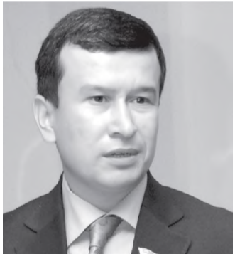
Нуриддин МУРОТОВ, Олий Мажлис Қонунчилик палатаси депутати, O'zLiDeP фракцияси аъзоси:

— Президентимиз фармонига асосан ҳўжалик субъектлари солиқ, молия ҳисоботлари тақдим этмас ва кўрсатилган манзилда мавжуд бўлмаса, давлат солиқ хизмати органлари фақат суд қарорига кўра унинг тижорат банкларидagi ҳисоблари бўйича операцияларни тўхлатиши мумкинлиги белгилангани мамлакатимизда икти-