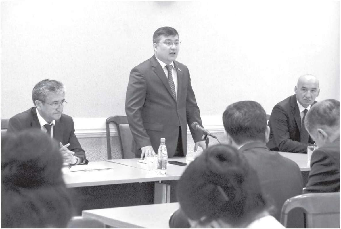
Солиқ ЗОИР олган сурат

Бугунги глобаллашув даврида ҳар бир соҳада бўлгани каби тиббиётда ҳам ахборот-коммуникация технологияларининг ўрни ва аҳамияти йилдан-йилга юксалиб бормоқда. Жумладан, кейинги пайтларда замонавий тиббиётда янги технология ва инновацион лойиҳа-