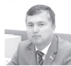
Равшан АСКАРОВ, Олий Мажлис Қонунчилик палатаси депутати, О'zLiDeP фракцияси аъзоси:

Ҳадемай мустақиллигимизнинг 23 йиллигини кенг нишонлаймиз. Ўтган тарихан қисқа даврда барча соҳаларда улкан натижаларга эришилгани ҳеч кимга сир эмас.