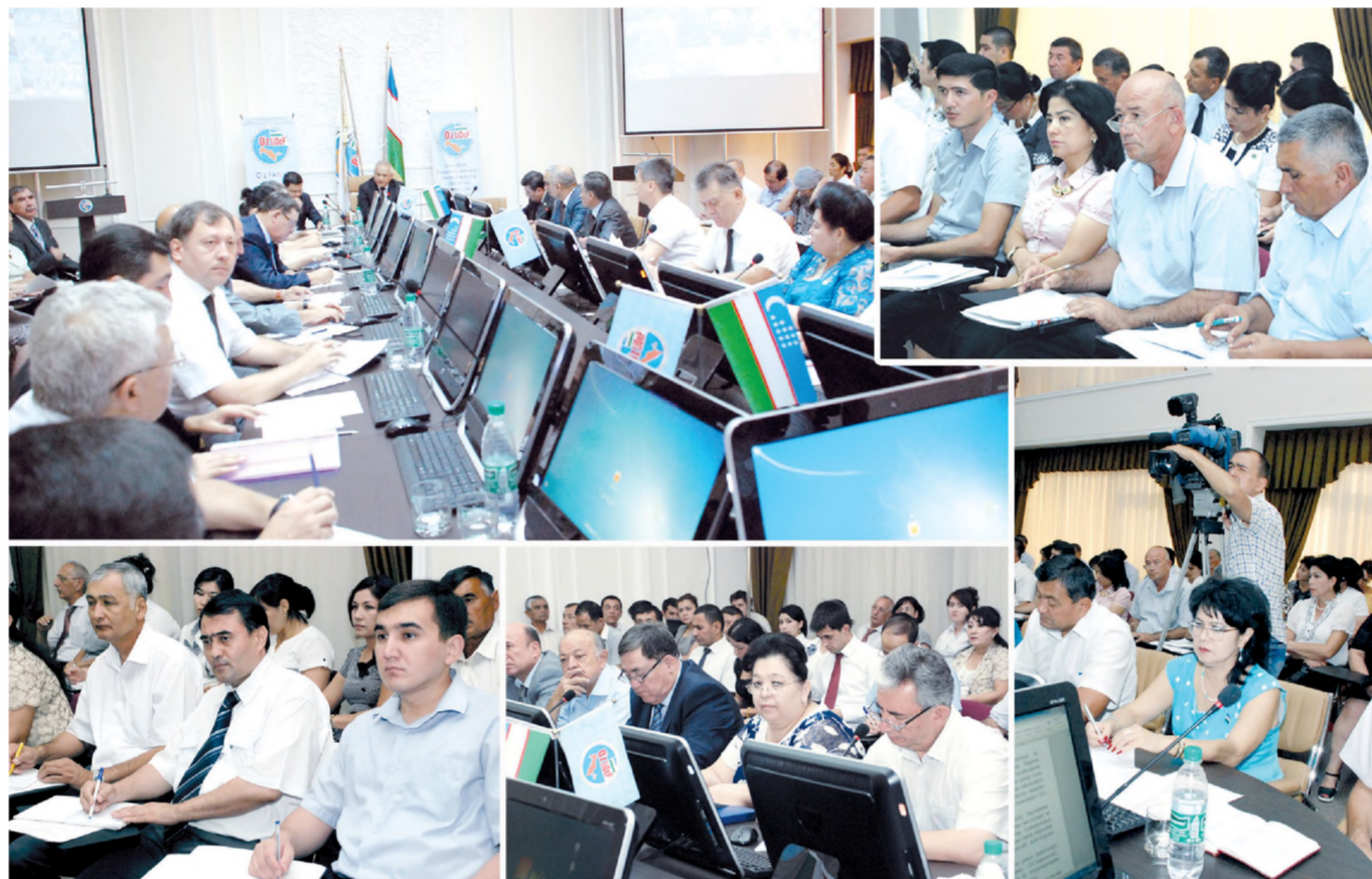
Солиқ ЗОИР олган суратлар