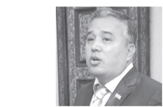
Фахриддин КОМИЛОВ, Олий Мажлис Қонунчилик палатаси депутати, О'зЛиДеП фракцияси аъзоси:

Айни чоғда тегишли қонунчилик ҳужжатлари янада тақомиллаштирилиб, соҳага оид ҳужжатларда фермер ҳўжаликлари кўп тармоқларда фаолият олиб боришини таъминлашга алоқиди эътибор қаратилмоқда. Жумладан, жорий йилнинг 20 январидида «Фермер ҳўжалиги тўғрисида»ги қонуннинг 22-моддаси фермер ҳўжалиги ўз уставида ва ер участкасини ижарага олиш шартномасида назарда тутилган иқтисодий мувофиқ, фаолият йўналишларини мустақил равишда белгилаши, қишлоқ ҳўжалиги ишлаб чиқаришининг ҳар қандай