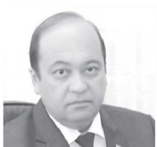
Қахрамон ЭРГАШЕВ, Олий Мажлис Конуңчилиқ палатаси депутати, О'зЛиДеР фракцияси аъзоси:

Ана шундай дамларда собиқ иттифоқ даврида «ўзбек ёшлари ҳеч нарсага қодир эмас, уларнинг қўлидан бирон иш келмайди» қабилидаги гаплар ёмғирдан кейинги қўзиқориндек урчигани ёдимизга тушади. Минг шукрки, жоначон Ўзбекистонимизнинг бугунги кунда эришган ютуқлари, жумладан, ёшларимиз қўлга киритган улкан зафарлар бунинг аксини кўрсатиб турибди. Буларнинг барига мустиқилликдек улуг нёъмат, халқини озодликнинг ойдин йўлига бошлаб чиққан инсон сабаб.