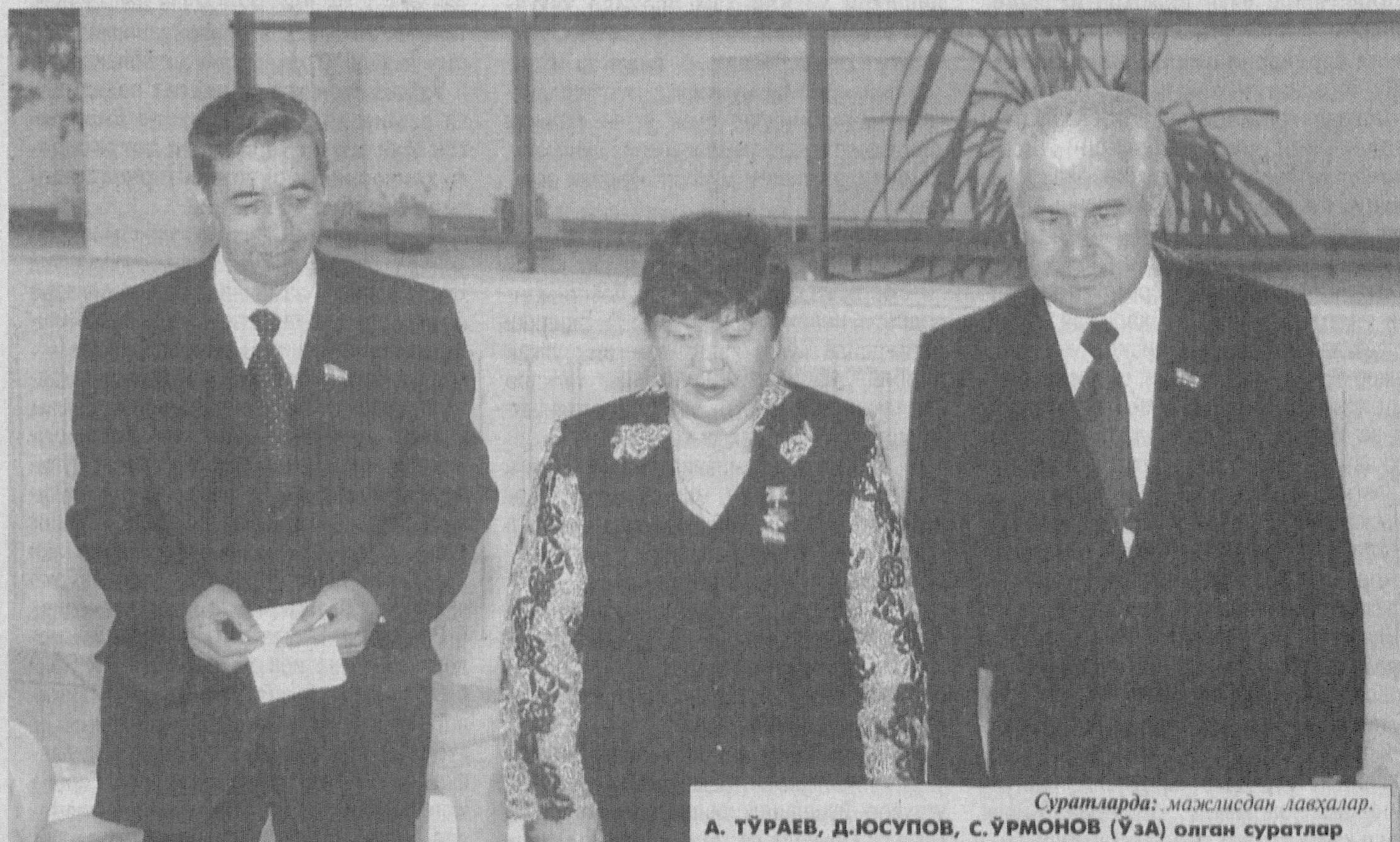
Суратларда: мажлисдан лавҳалар.

2. Ушбу қарор Ўзбекистон Республикаси Президентига юборилсин. 3. Ушбу қарор қабул қилинган кундан эътиборан кучга киради. Ўзбекистон Республикаси Олий Мажлиси Сенатининг Раиси М.ШАРИФХЎЖАЕВ Тошкент шаҳри, 2005 йил 28 январь