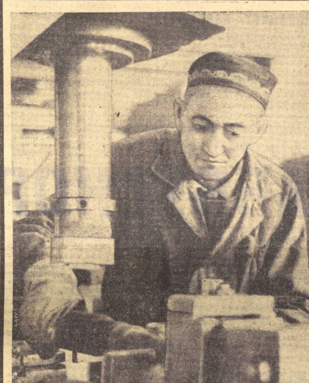
КПСС Марказий Комитетининг партияга, совет халқига Мурожаатида янада юксак социалистик мажбуриятлари оид, санаот, қурилиш, транспорт ва бошқа тармоқларнинг барча ходимларини 1974 йил халқ хўжалик планини муддатидан илгари бажариш учун Бутуниттифоқ социалистик мусобақасини кенг аяқ олдирганига даъват этилди.

Беш йилликнинг учинчи, ҳақ қилувчи йилида пахтачиликни юксалтириш учун яқин замин яратилди. Республикани пахтачилари ўша йил мўл ҳосил етиштиришди. Шунинг қувоничини, бригадани республика галабасига ўз ҳиссасини қўшишга муваффақ бўлди.