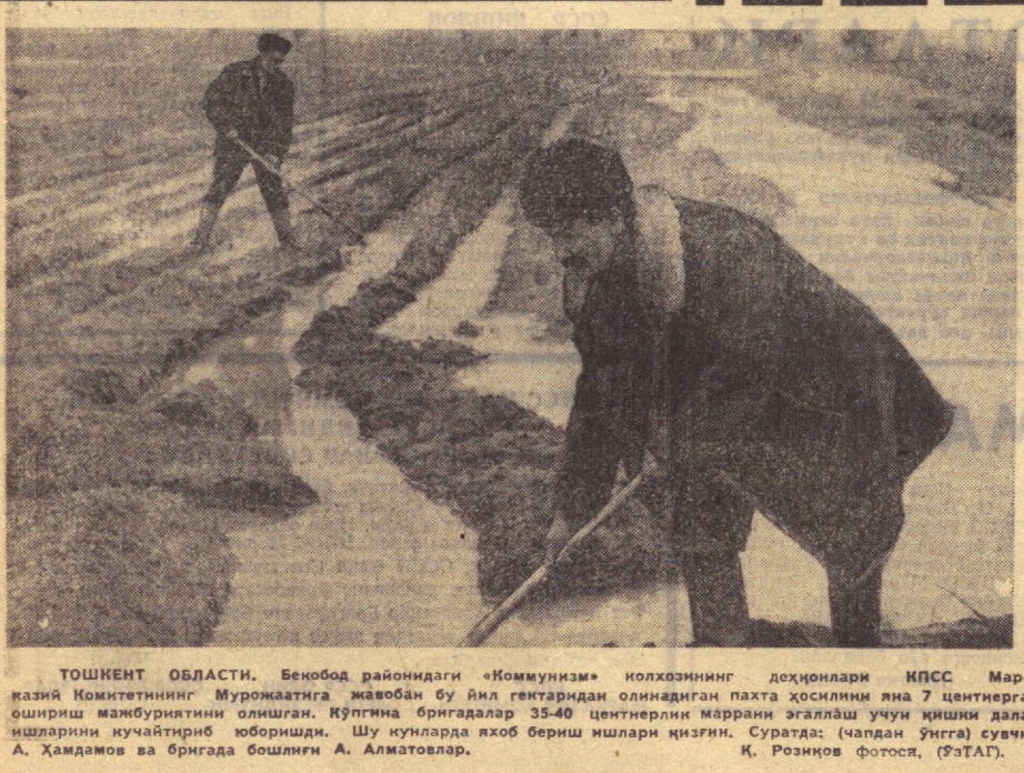
ТОШКЕНТ ОБЛАСТИ. Бенобод районидидаги «Коммунизм» ноҳосининг доҳсонлари КПСС Марказий Комитетининг Мурожаатига жавобан бу йил гектардан олиндиған пахта доҳсонлари 7 центнерга ошириш мажбуриятини олишди.