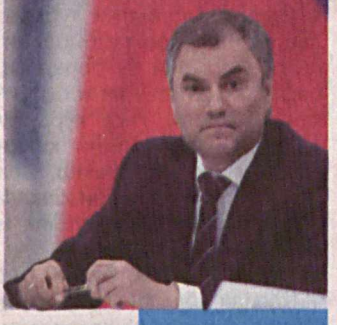
Вячеслав ВОЛОДИН, Россия Федерацияси Давлат Думаси Раиси.

"Иккала мамлакат ўртасидаги ҳамкорлик Россия ва Ўзбекистон раҳбарларининг муносабатларини шиддат билан ривожлантириш юзасидан ташаббус кўрсатаётгани сабаб янада юксалмоқда. Биз давлатларимиз ўртасидаги стратегик шериклик тобора мустаҳкамланиши учун имкон борича ҳаракат қиламиз. Масалаларни биргаликда ҳал этишда янги ва иккала томон учун ҳам бирдек манфаатли ечимларни топишга интиламиз. Мазкур масалаларда самарали келишувларга эришиш нафақат ўзаро махсулот айирбошлаш ҳажминини ошириш, балки гуманитар соҳа, таълим, парламентлараро алоқаларга ҳам бирдек тааллуқли".