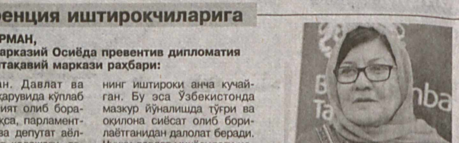
Дилбар НАЗАРИЙ, Афғонистон хотин-қизлар масалалари бўйича вазири:

салалардан бўлди. Мутахассисларнинг фикрича, унга фақат аёллар ва эркеклар ҳуқуқларининг ўзаро тенглиги сифатида қараш нотўғри. Янада чуқурроқ ёндашилса, гендер тенглик замирида аёлларнинг мавжуд салоҳияти ва имкониятларидан самарали фойдаланиш, уларнинг бахтли ҳаёти жамиятдаги тинчлик ва фаровонлик гарови эканини англаш тушунилади. Аёл — оиланинг мустаҳкамлиги ва фаровонлигини таъминлаш баробарида, фарзандлар тарбиясида етакчи куч бўлиб келган ва шундай бўлиб қолади. Демак, мамлакатда гендер тенглиги ма-