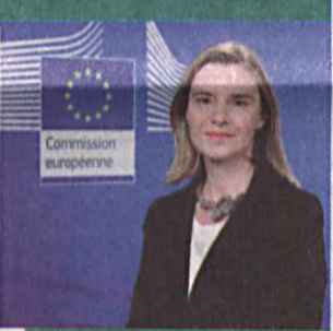
Федерика МОГЕРИНИ, Европа Иттифоқининг ташқи ишлар ва хавфсизлик сиевати бўйича Олий вакили — Европа Комиссияси вице-президенти

— Ўзбекистонга бир йил ичида икки марта таширф буюриб, мамлакатда амалга оширилаётган кўламли ислохотлар ҳамда Ўзбекистоннинг минтақавий тараққиётдаги конструктив ролига шахсан гувоҳ бўлдим. Биз Европа Иттифоқи ва Ўзбекистон ўртасидаги кенг қамровли ўзаро муносабатларга содиқ эканлигимизни қатъий намён этмоқдамиз.