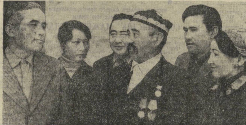
Суратда: очик партия йиғилиши қатнашчиларидан бир гуруҳаси.

Доҳиймиз В. И. Ленин ижрони контрол қилиш ва текшириш партия ташкилотчилик фаолиятининг энг муҳим таркибий қисми, асосий воситаси, деб ҳисоблаган эди. У бу-тун фаолияти давомнда қарор ижросининг ҳайтбахш кучига юксак баҳо берди. Қарор интизоми кучайтириш, партия ташкилотла-рининг меҳнатшарлар билан алоқасини муста-ҳкамлаш, кенг оммани давлат ишларини бошқаришга жалб этилиши муҳим тарови эканлигига қайта-қайта эътиборни қаратди.