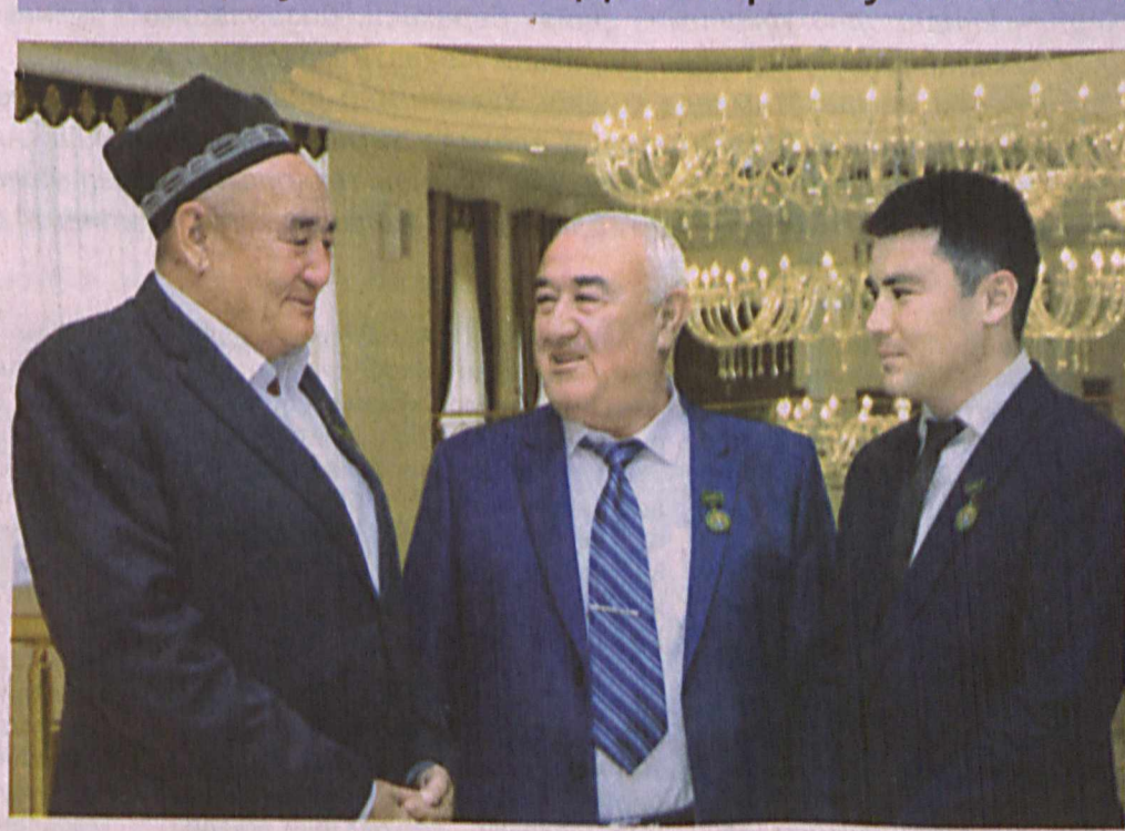
Шавкат Мирзиёев (ўрта) билан қишлоқ хўжалиги ходимлари куни муносабати билан табриқланаётган қишлоқ хўжалиги ходимлари.

Мамлакатимизда Ўзбекистон Республикаси қишлоқ хўжалиги ходимлари куни кенг нишонланмоқда.