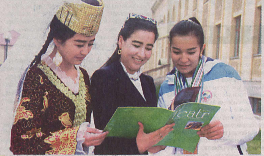
В Андижане прошла областной этап конкурса на Государственную премию имени Зульфии.

В этом году в области в отборочных этапах участвовали более трех тысяч одаренных девушек, а в областном этапе свои возможности и мастерство продемонстрировали 170 девушек по таким направлениям, как литература, наука, образование, культура, спорт и общественная деятельность. По итогам конкурса признаны победительницами 14 девушек, достигших лучших результатов. Их научные и творческие работы были вывешены на республиканский этап конкурса.