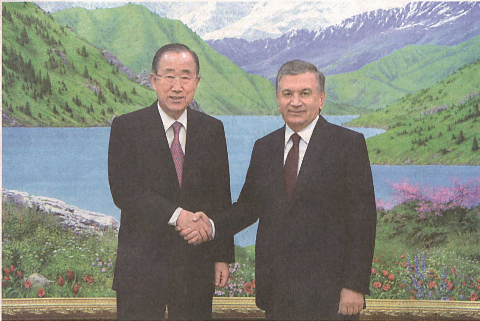
Президент Республики Узбекистан Шавкат Мирзиёев 27 ноября принял бывшего Генерального секретаря Организации Объединенных Наций Пан Ги Муна, возглавляющего в настоящее время Ассамблею Глобального института зеленого роста и Комиссию по этике Международного олимпийского комитета.

Пан Ги Мун прибыл в нашу страну для участия в Международной конференции по вопросам улучшения экологической ситуации в зоне Приаралья и роли в этом процессе корейской диаспоры, которая прошла в Нукусе.