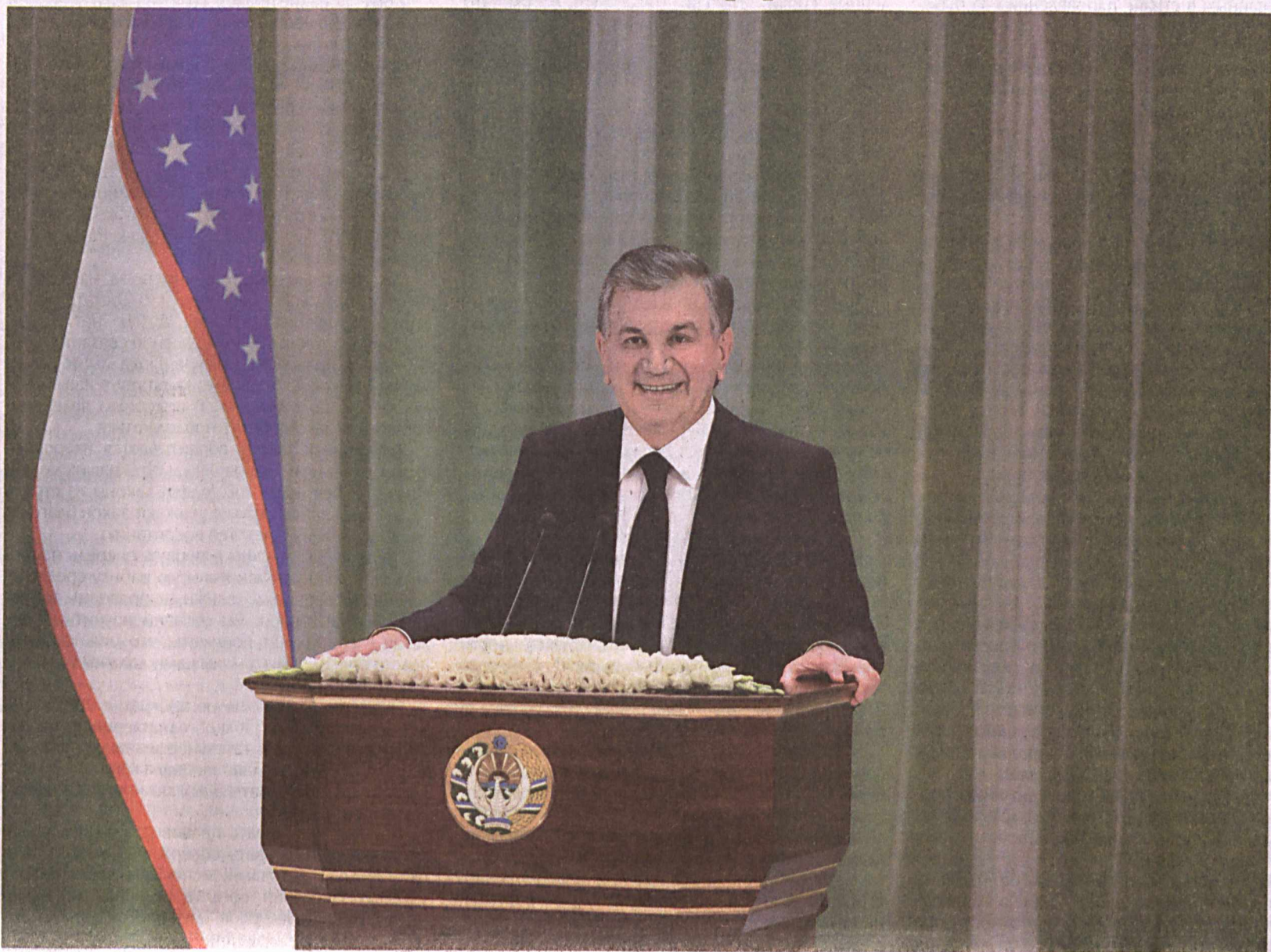
Во Дворце международных форумов "Узбекистон" 7 декабря состоялась торжественное собрание, посвященное 26-летию принятия Конституции Республики Узбекистан. В нем приняли участие государственные и общественные деятели, представители производства, науки, культуры, искусства и спорта, широкой общественности, аккредитованного в нашей стране дипломатического корпуса и международных организаций.

Прозвучал Государственный гимн Республики Узбекистан.