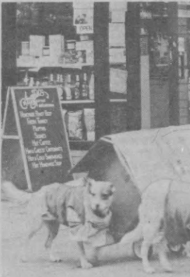
Сэндерсов начали «выкуривать»...