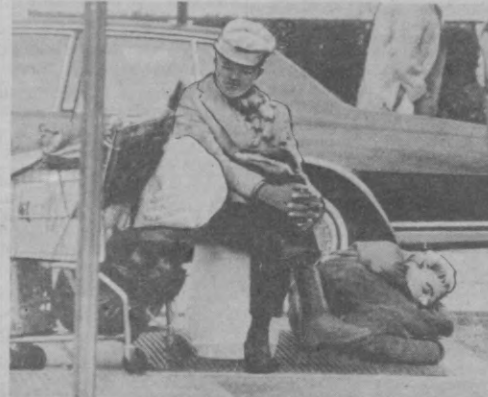
Для этих людей — отверженных общества «равных возможностей»...