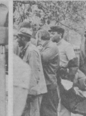
Каждый год в День благодарения в Лайфайт-парке...