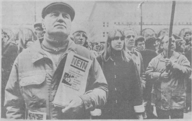
«Нет — проекту «звездных войн» СОВ. ФРГ не должна в нем участвовать...»