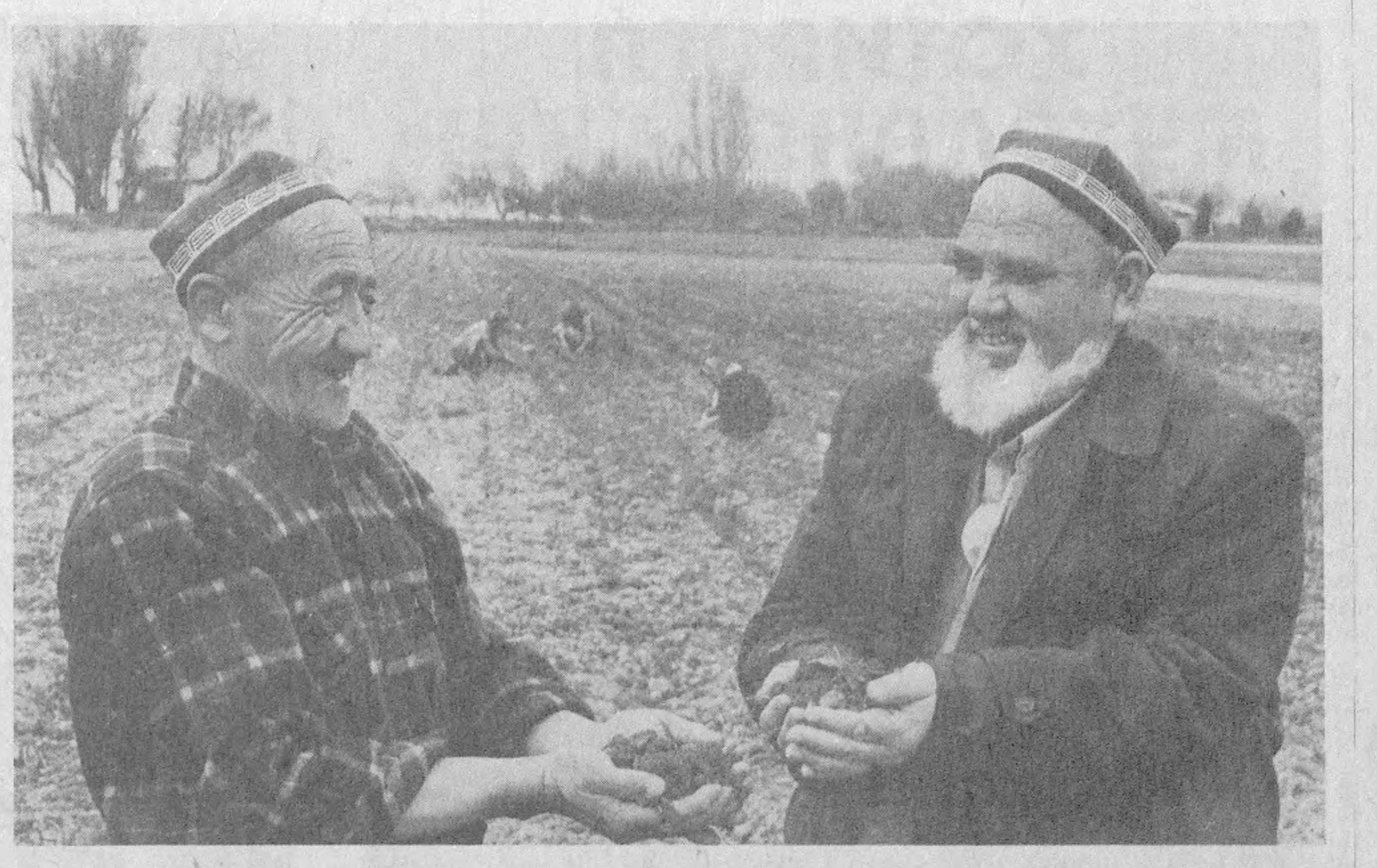
● БАҲОР, НАВРУЗ ВА МЕХНАТ — эгизак. Яшарин ва гузаллик нишонлари, одатан, боллардан, далалардан, қир-ларлардан бошланади. Бугун Она-замин турпои илиқлик-дан энтикиб, бўлажак ризк-руз неъматларидан дарак бериб турпти...

нг, Бу бениҳоя гўзал, латиф, илқиклига ошифтадур. Ана у... кўпни кўрган нуруний отахонлар, мунис ва меҳри-бан онахонларни, қарилар-нинг кўнглини олсам, руҳла-рини кўтарсам деб жонсарақ бўляпти. — Азизлар, — дейди у. — Менинг руҳсормини томо-шо қилинг, кўзларимга тики-линг, бир сония бўлсада бир-га бўлинг, бирга нафас оли-нг, ўзларингизнинг навқирон ёшлигинизни бир дам бўл-сада қўз ўзингизга келтира-сиз, ғам-тавишларингиз бўл-са, унутасиз. Хаста бўлсангиз, дардингиз чекинади, тетикла-шасиз, бардам бўласиз. Наврузой... У ўрик ва бодом гуллари-