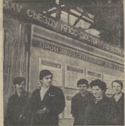
Бутун мамлакатимиздаги сингари республикамиз санонат корхоналари, куринлиқ, транспорт ташкилотлариди ҳам ўнинчи беш йиллигининг дастлабини зарбдор меҳнат вахтаси уюшқорлик билан бошлаб юбориди...