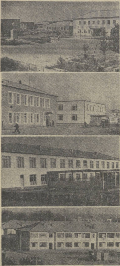
Сирдарё ва Жиззах областларининг Дусллик ҳамда Оқ олтин районлари марказларида кўп қаватли замонавий уй-жой, мактаб ва боғча бинолари барпо этилмоқда. Қўрمان майдонлар, кенг ва равои қишқар вужудга келтирилмоқда.