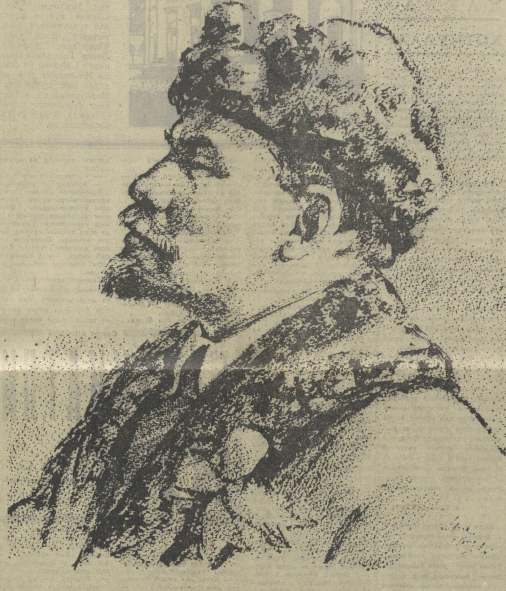
СССР халқ rassови Н. Н. Жуков чизган расм.

Партия ва халқнинг абадий барҳаёт Ленин ишига, буюк ленинизм ғояларига ҳеясид садоқати — эришаётган ва эришамак барча ғалабаларимизнинг битмас-туғанмас манбандир.