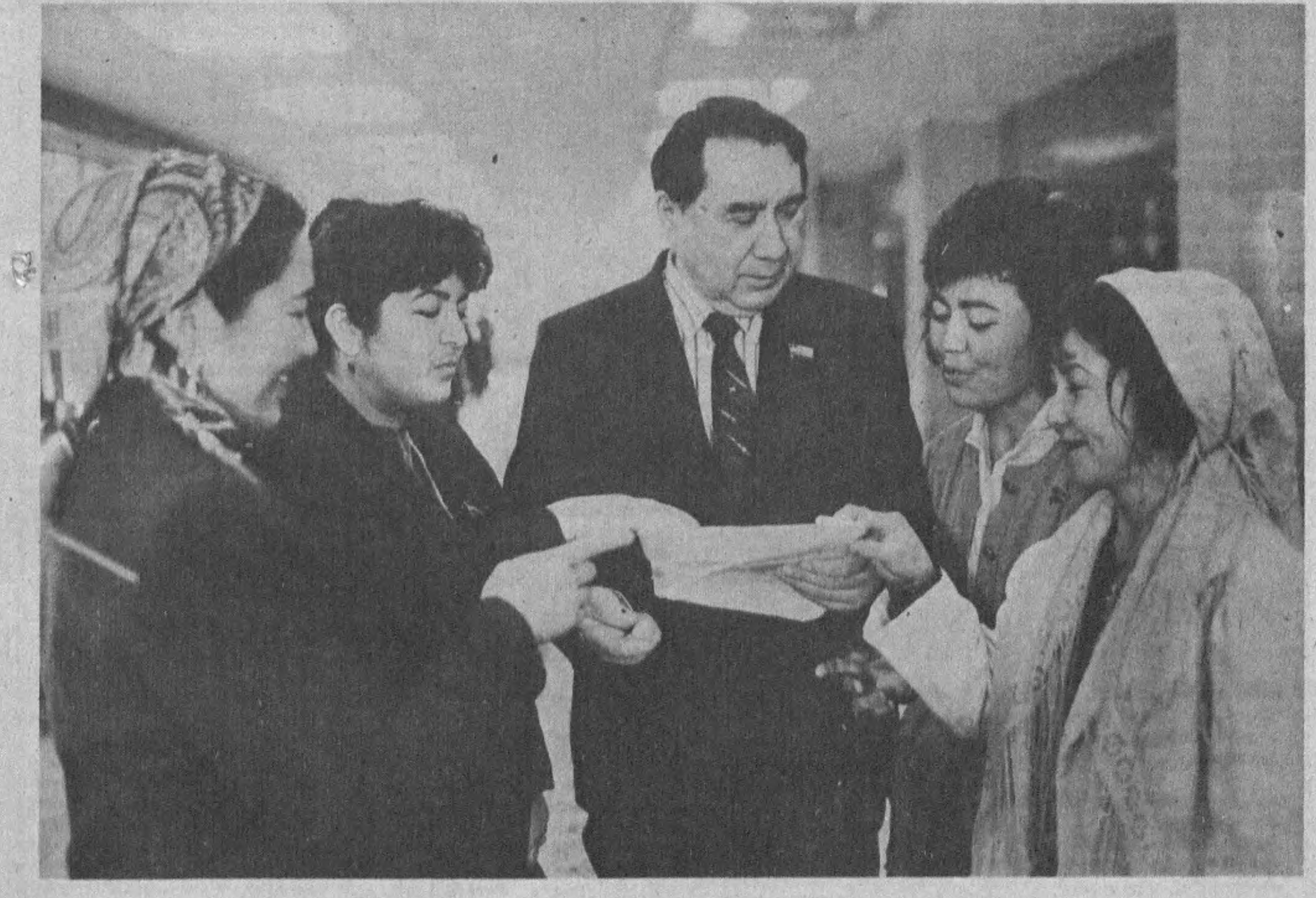
Ўзбекистон Республикаси Олий Кенгашининг навбатдан ташқари тўққизинчи сессияси. Танаффус пайтидаги ўзаро суҳбат.

1941 йилда Тошкент шаҳрида туғилган, ўзбек, олий маълумотли, ихтисоси — механик-инженер. 1962 йилда Тошкент политехника институтини битирган. Меҳнат фаолиятини 1962 йилда «Герметик» технология ва машинасозлик марказий конструкторлик бюросининг муҳандиси бўлиб бошлаган, кейинчалик шу ерда бир қанча раҳбарлик лавозимларида ишлаган. 1973 йилдан партия ишида — Ўзбекистон Компартияси Тошкент вилоят комитети ва Марказий Комитети аппаратида ишлаган. Ўзбекистон Компартияси Олмалиқ шаҳар комитети, Хоразм ва Тошкент вилоят комитетларининг биринчи котиби бўлган. 1989—1990 йилларда Ўзбекистон ССР Вазирлар Кенгашининг Раиси бўлган. 1990 йилда Ўзбекистон ССР Халқ назорати комитетининг раиси этиб тайинланган. Ўзбекистон Республикасининг халқ депутати.