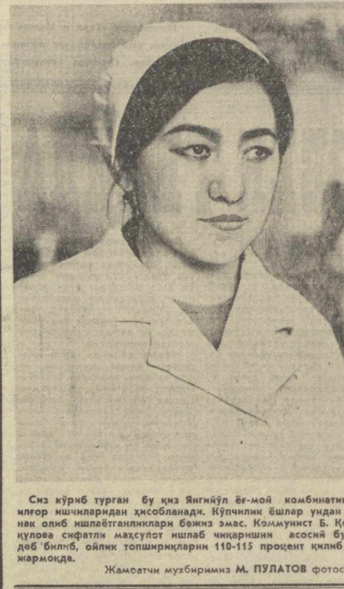
Сиз кўриб турган бу қиз Янгиқўрғон район комбинатининг илгор ишчиларидан ҳисобланади.