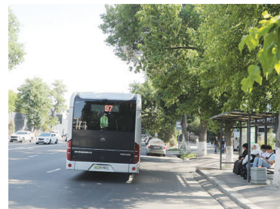
Шайхонтоҳур тумани, Нурафшон айланма йўли

2022 йилда қабул қилинган қарорда Тошкент шаҳар ҳокимлигига Қурилиш вазирли-