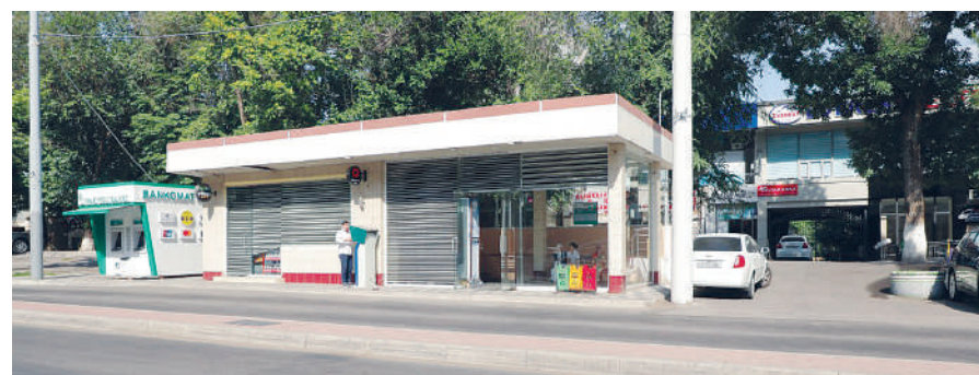
Юнусобод тумани, Амир Темур шоҳ кўчаси

Ҳайдовчиларнинг сўзларига кўра, баъзи бекатлардаги дўконлардан чиқариб қўйилган музлаткичлар ҳаёт учун ўта хатарли экан. Уларнинг электр симларининг созлигига ҳеч ким қафолат берайи. Агар бирор бир фавқулодда ҳолат рўй бериб, ёнгин юзага келса, пластик ромлардан қурилган дўкон-