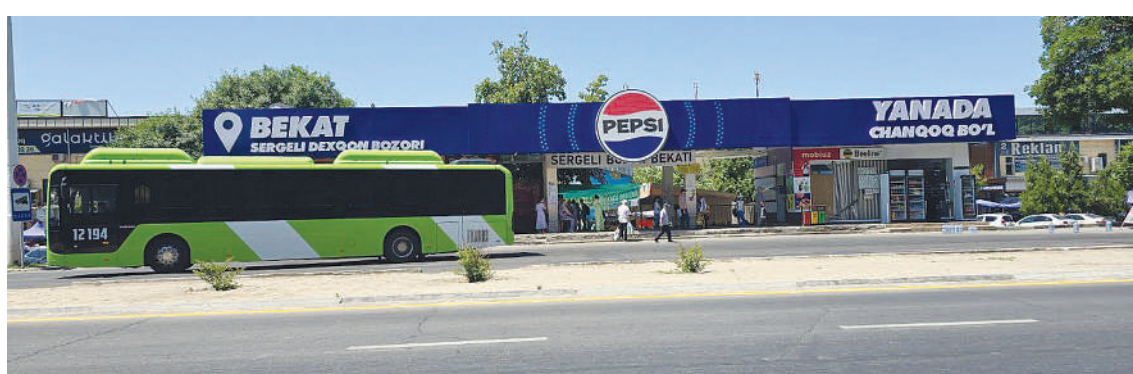
Сергели тумани, Янги Сергели кўчаси