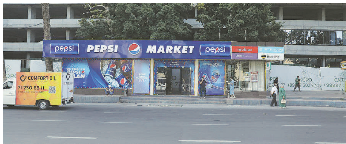
Яккасарой тумани, Шота Руставели кўчаси

Тошкент 2200 йилдан ортиқроқ тарихга эга бўлган кўхна кент. Миллодан аввалги иккинчи асрда қадимий Хитой кўлэмаларида шаҳар ҳақидаги илк маълумотлар пайдо бўлгани айтилади.