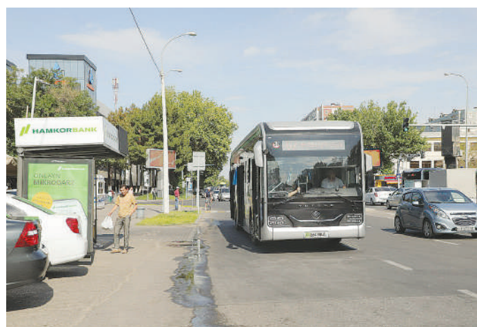
Шайхонтоҳур тумани, Осие кўчаси

Сир эмаски, шаҳар аҳолиси ва меҳмонларнинг катта қисми жамоат транспортларидан фойдаланади. Шунга қараб пойтахт транспортини қулайлаштириш чоралари кўриляпти.