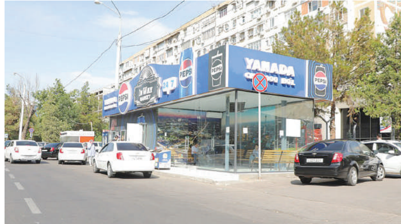
Миробод тумани, Шаҳрисабз кўчаси

Яна бир муҳим масала бекатлар билан боғлиқ. Замонавий транспортларга мос бекатлар қуриш бўйича ҳам вазифалар белгиланган. Тошкент шаҳар ҳокимлигининг тегишли қарори билан намунавий бекатлар