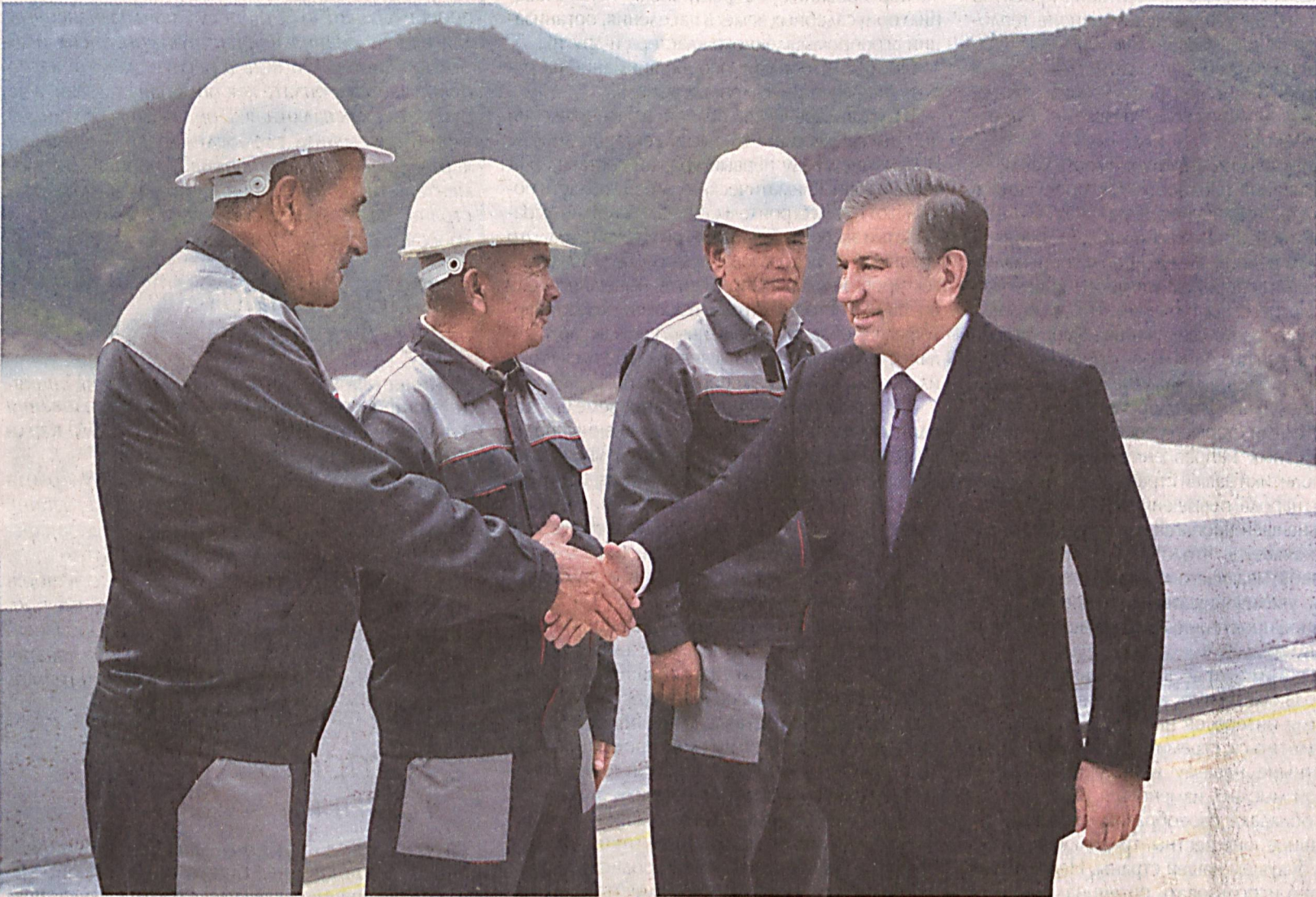
Президент Республики Узбекистан Шавкат Мирзиёев в целях ознакомления с социально-экономическим развитием региона, ходом созидательных работ, исполнением данных ранее поручений 30 апреля прибыл в Сурхандарьинскую область.

Глава нашего государства в ходе посещения Сурхандарьинской области 19-20 января 2018 года ознакомился со множеством перспективных проектов, определил соответствующие задачи по качественному расширению в районах и городах масштабов строительно-созидательных работ, динамичному развитию сфер промышленности, сельского хозяйства, туризма, обслуживания и сервиса, созданию достойных жизненных условий для населения.