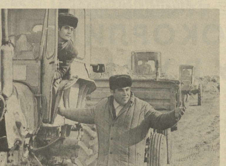
ТАНИШИНГ: ХАЛҚ НОМЗОДЛАРИ

Сизга бир гап айтсам, — деганди ўшанда Шоберов ака, — яқинда қишлоғимизни паства, қўлга кўчиришар эмниш. Ҳўш, бунинг нимаси аяқш? — аянабланиб, елка қисди ҳамсуҳбат, — Тугли-лус ўсаган жойингизга нима етсини, ака! Қийин қонимиз шу ерда тунилаган.