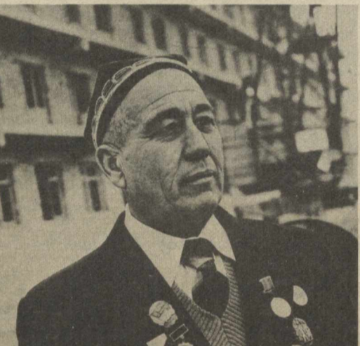
Ўзбекистонда округ сайловоти кенгашлири ақдиллик вазиятида ўтмоқда. Кенгаш қатнашчилари Ўзбекистон ССР Олий Совети депутатлигига номзодлар кўриштириш тўғрисида меҳнат коллективлари йиғилишларининг қарорларини астойдил маъқулламоқдалар.

«Джизакстрой» қурилиш ташкилотидан бинокорларнинг ташаббускорлигини ошириш, бўлиналлар орасида мусобақани кенг йўлга қўйиш, қурилиш сифатини тубдан яхшилаш ўрнига кўзбўямачилик билан шугулланиш фактлари ҳам юз берганди. Бу