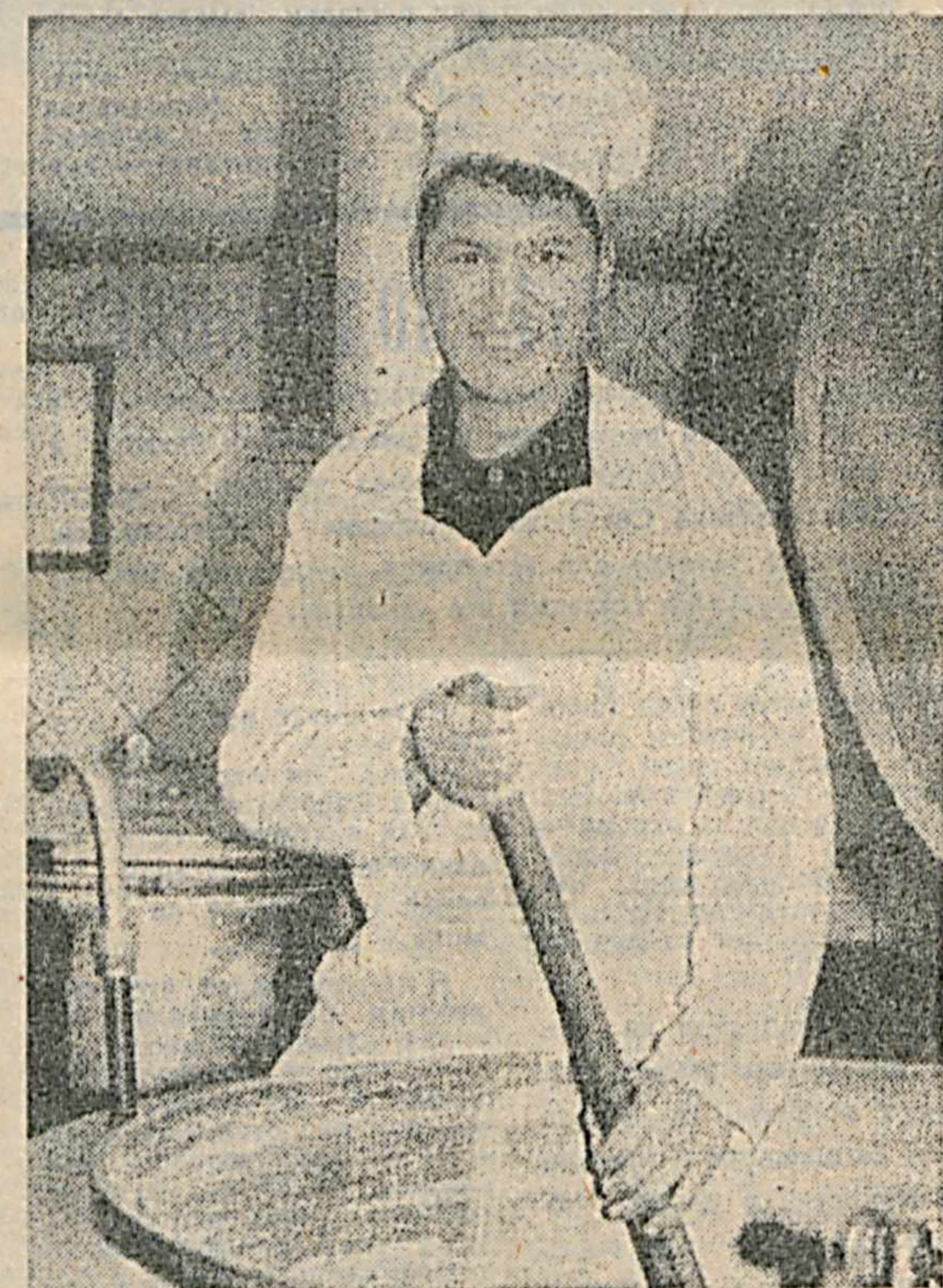
Озод юртимиз куролли ҳамюртлари — Ҳа муқаддас бурларига содиқ посбонларимиз дастурхон, қачон қарамиш, тўки...