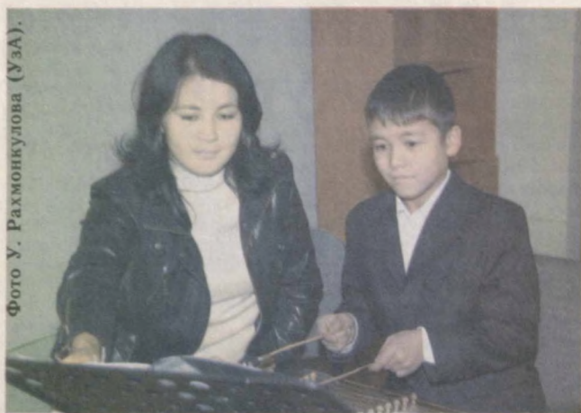
Молодежь нового времени