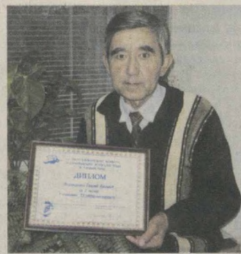
Оксана Кадышева.