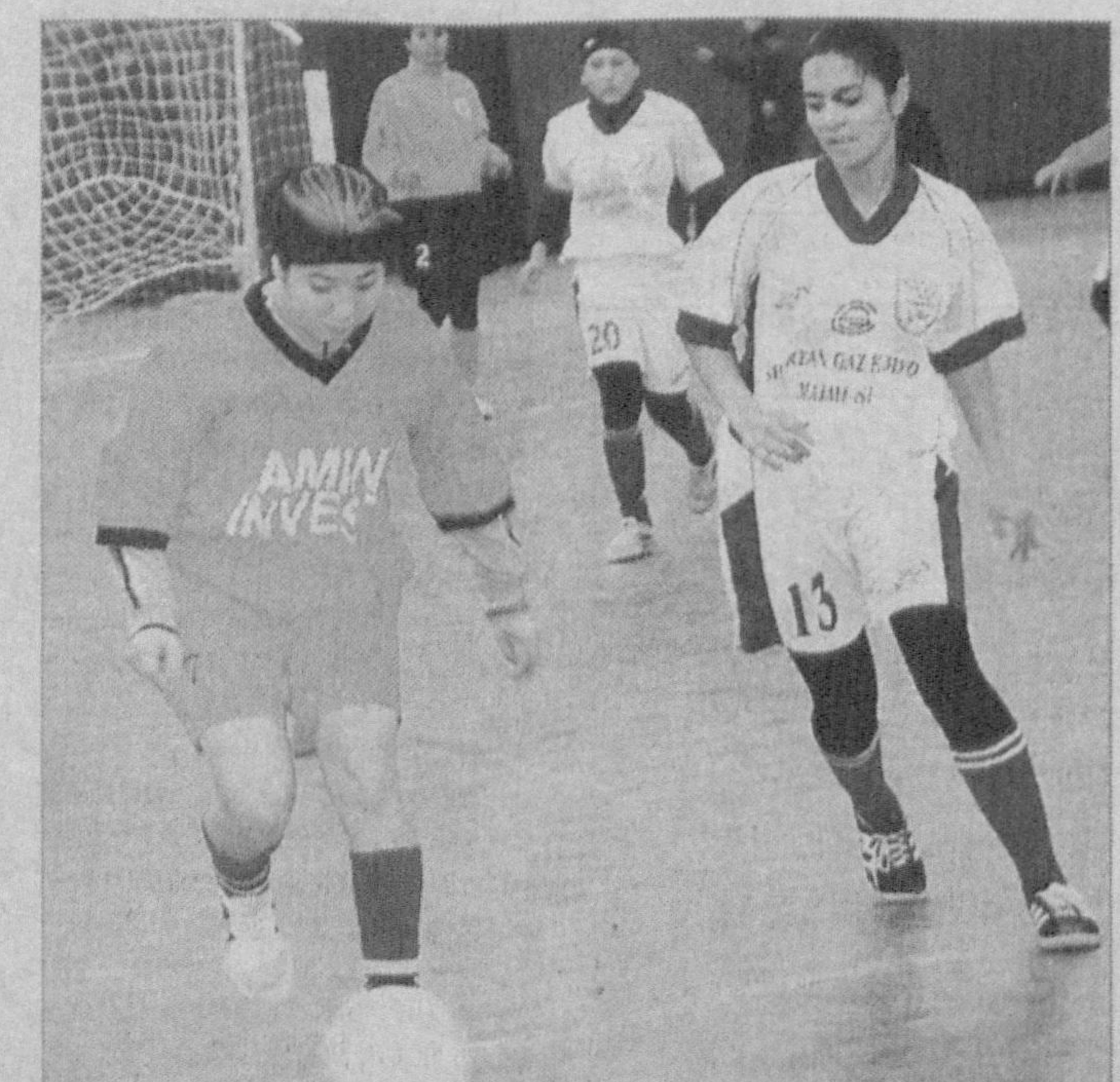
Суратларда: «Амин-Инвест» қизлар мини-футбол жамоаси; мусобақадан лаҳза.

Жомбойда мини футбол бўйича «Амин-Инвест» қизлар жамоасига асос солинганига ҳали кўп бўлгани йўқ. Яқинда жомбойликлар пойтахтимизда уюштирилган Ўзбекистон III чемпионати биринчи босқич баҳсларида муносиб қатнашиб, мутахассисларда илиқ таассурот қолдирди.