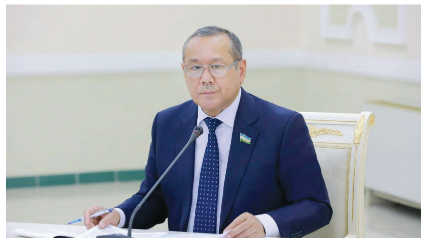
Улуғбек ИНОЯТОВ, Олий Мажлис Қонунчилик палатаси Спикери ўринбосари, Ўзбекистон Халқ демократик партияси Марказий Кенгаши раиси.

ДУНЁ ИЛМ-ФАНИ РИВОЖЛАНИШНИНГ ЯНГИ БОСҚИЧЛАРИГА ҚАДАМ ҚўЯЁТГАН, ТАЪБИР ЖОИЗ БЎЛСА, СУНЪИЙ ИДРОК ҲАЁТИМИЗНИНГ БАРЧА ЖАБҲАСИГА ФАОЛ КИРИБ ҚЕЛАЁТГАН АЙНИ ПАЛЛАДА АГРАР ДАВЛАТ ФАКОМИНИ БЎЙИНГА ОЛИБ ЯШАШ ТАРАҚҚИЁТГА ИНТИЛАДИГАН МАМЛАКАТГА МУНОСИБ ҲОЛАТ ЭМАС. МАНА ШУ ҲАЁТИЙ ЗАРУРАТНИ ЎЗ ВАҚТИДА АНГЛАБ, КАДРЛАР ТАЙЁРЛАШ ЎЗАНИНИ ЗАМОНАВИЙ ТАЛАБЛАРГА ЙЎНАЛТИРМАГАН ДАВЛАТ ҲАМ, ОЛИЙ ТАЪЛИМ ТИЗИМИ ҲАМ, ЖАМИЯТ ҲАМ МУҚАРРАР ЮТҚАЗАДИ.