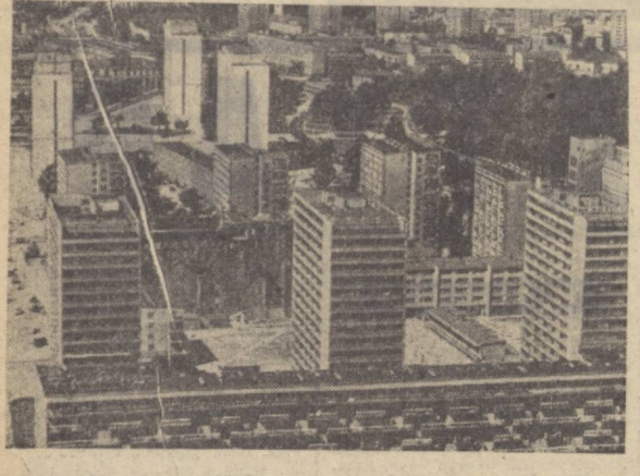
ВАРШАВА. Бундан 25 йил муқаддам Совет Армияси ва Польша кўшинларининг 1-армияси Варшава шаҳрини немис-фашист босқинчиларидан озод қилдилар. Душман бу кўрнам шаҳарни ер билан янсон қилган эди. Ҳаммасини қайтадан тинлашга тўғри келди. Кул тепалари ва вайроқалар ўрнида ҳад кўтарган Варшава кўндан-кўнга ободонлашиб бормоқда. Суратда: шаҳарнинг янги районларидан бирининг умийи.