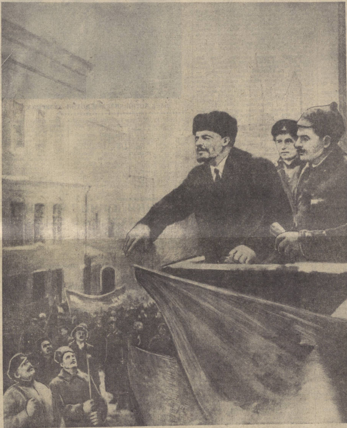
В. И. Ленин 1919 йилда Моссовет балконида туриб нутқ сўзламоқда.

Уртўл райондан олинган ана шундай хабарлардан бирда айтилишича, «Правда» колхозининг чорвадорлари юбилей вахтасида туриб, катта галабани кўлга киритдилар. Улар ўт-