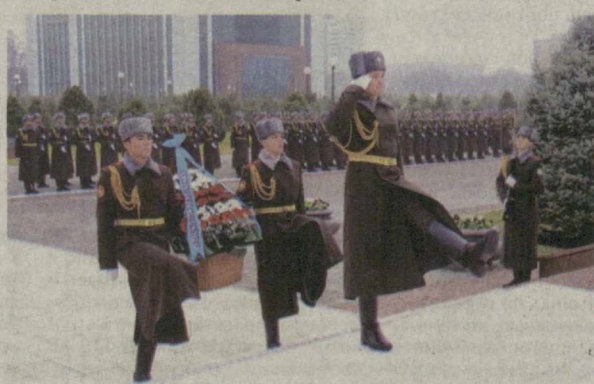
В честь празднования 23-й годовщины со дня образования Вооруженных Сил Республики Узбекистан и Дня защитников Родины на площади Мустакилик в Ташкенте прошло торжественное возложение цветов к подножию монумента Независимости и гуманизма, являющегося символом нашей свободы, светлого будущего и благородных устремлений.