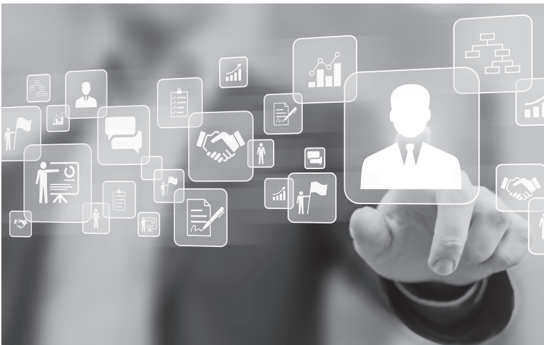
ва ўзгаришлар киритилмоқда.

Шу маънода Олий Мажлис Сенатининг 53-ялпи мажлисида юридик шахс мақомига эга бўлмаган касаба уюшмаларининг бўлинмалари ва бошланғич касаба уюшмалари ташкилотларининг давлат рўйхатидан ўтказиш тартибини белгилувчи қонун маъқулланганини алоҳида таъкидлаш жоиз. Айтиш керакки, ушбу янги қонун асосида "Касаба уюшмалари тўғрисида"ги қонун ҳамда Солиқ кодексига тегишли қўшимчалар