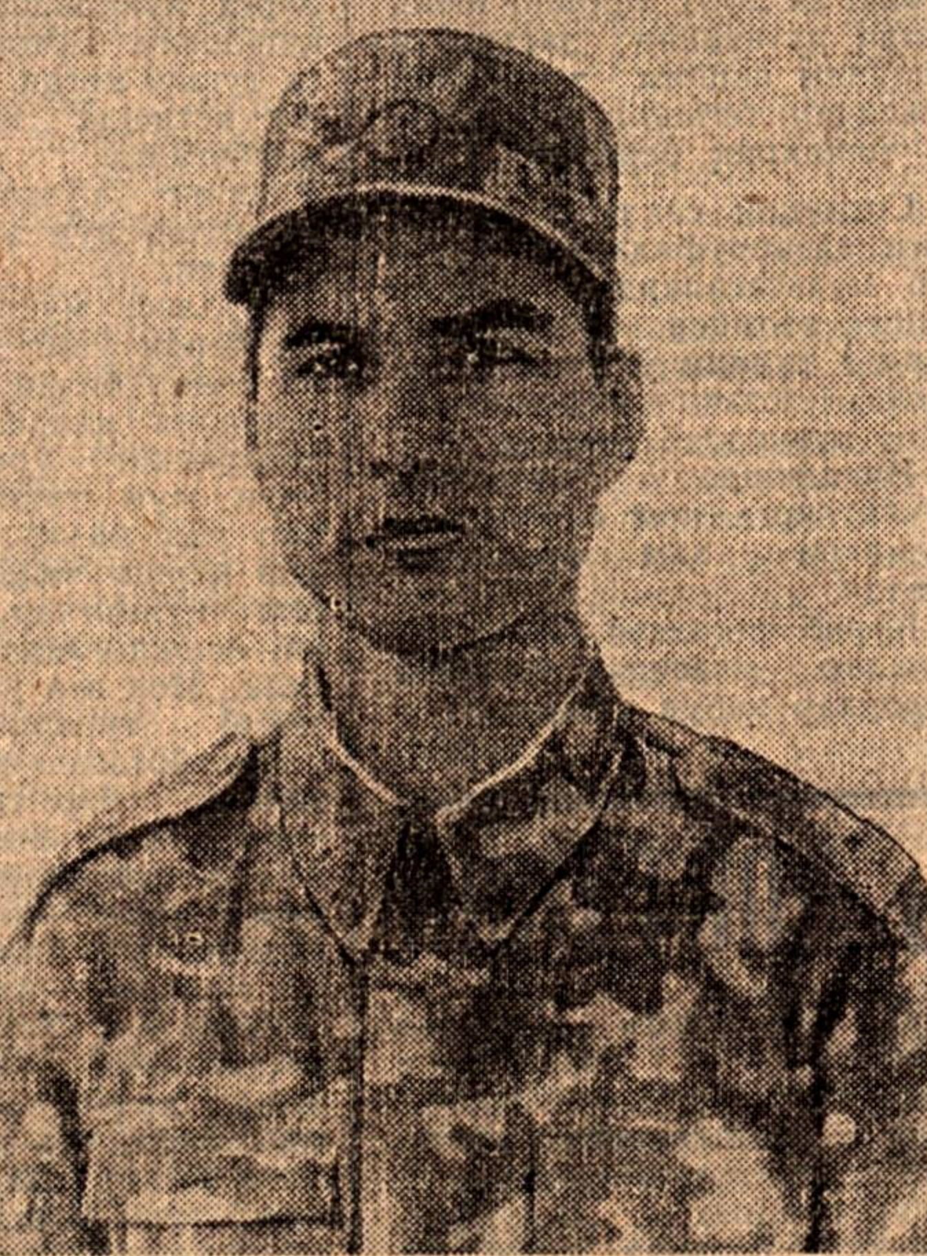
ИЗВЕСТИЙ ОБОЙ ОЖИДАНИИ СЛУЖБЫ. РАЗМЕРЕННАЯ ГРАЖДАНСКАЯ ЖИЗНЬ НАЧИНАЕТ ТАГОТИТЬ СУЛЕЙМАНА. ВСЕ ЧАЩЕ И ЧАЩЕ ВОСПОМИНАЮТ АРМЕЙСКИЕ ГОДЫ, ПАМЯТЬ О КОТОРЫХ СОХРАНИЛА МАССУ НАИЛУЧШИЕ ВПЕЧАТЛЕНИЯ. ДЕНЬ ЗА ДНЕМ В ЕГО СОЗНАНИИ КРЕПНЕЕТ РЕШЕНИЕ С НОВАЯ ВСТАТЬ В АРМЕЙСКИЙ СТРОЙ. И В КО-

Замер строй... Стояно раскаты грома, грянула медь духового оркестра. Звук «Встречного марша» прядли будничному построению личного состава атмосфере торжественности. Монолитные становятся ряды, светлеют лица воинов. А трубы, баяроны и алаты уже выводят новую мелодию. Ее упругая ритмика зовёт заштыкуются на новые свершения и достижения. Так повторяется изо дня в день, и так будет всегда, ибо светлый, блестящий тон военной музыки помогает воину преодолевать тяготы армейской службы, учёт его твердой поступи идти по жизни.