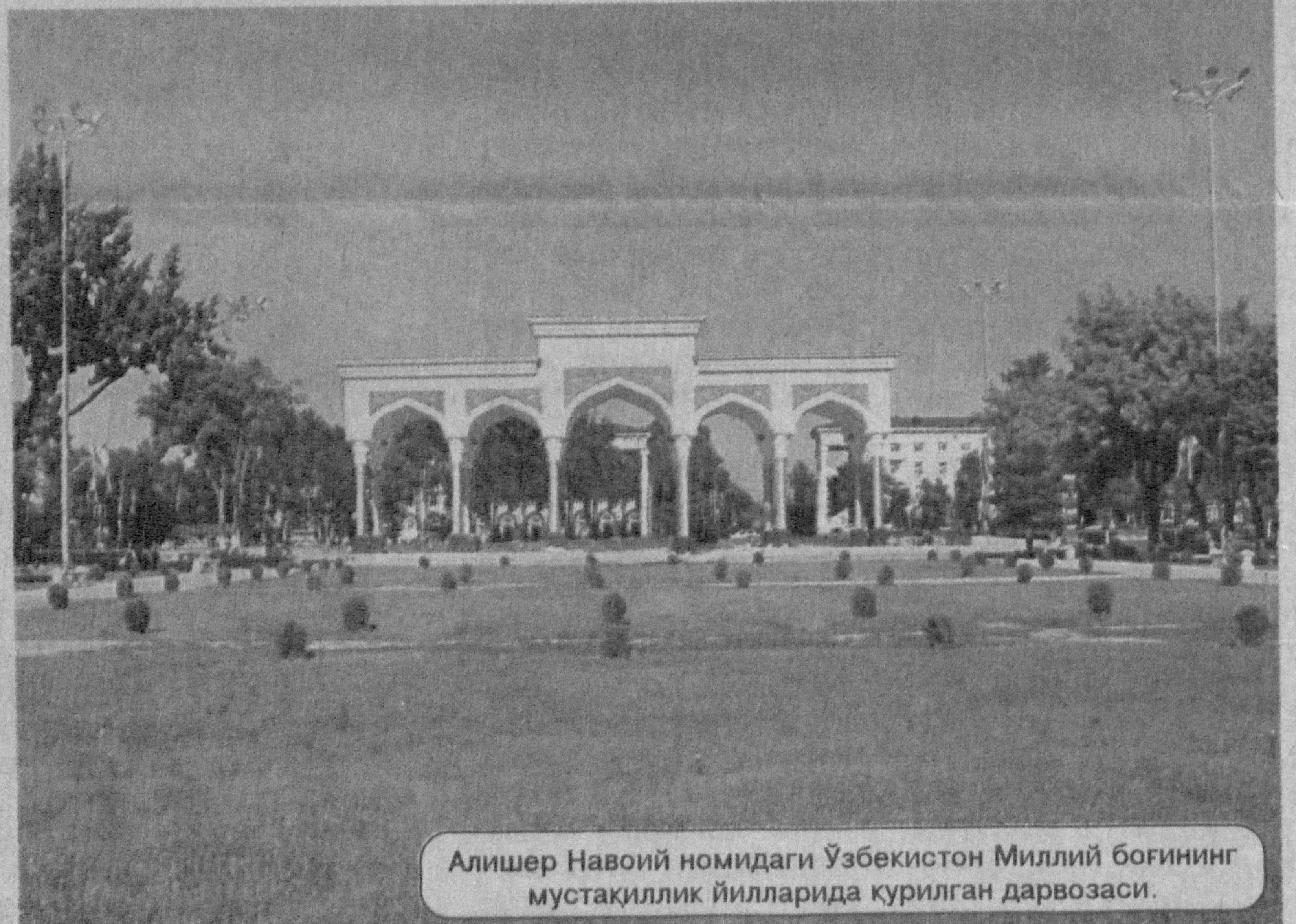
Алишер Навоий номидаги Ўзбекистон Миллий боғининг мустақиллик йилларида қурилган дарвозаси.