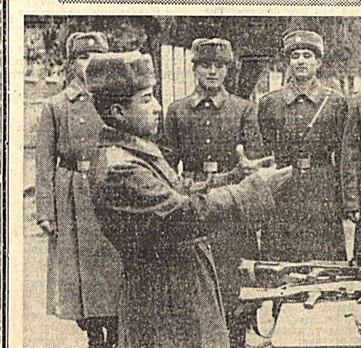
Қисм ва бўлимларда бошланган йилги ўқув мавсуми машғулотлари қизғин давом этмоқда. Озод юртининг посбонлари ҳарб элминдан пухта сабоқ олиш учун астойдил интилламоқдалар. Бунда жорий йил кўзда сафта қўшилган ёш аскарларнинг илк хиз-