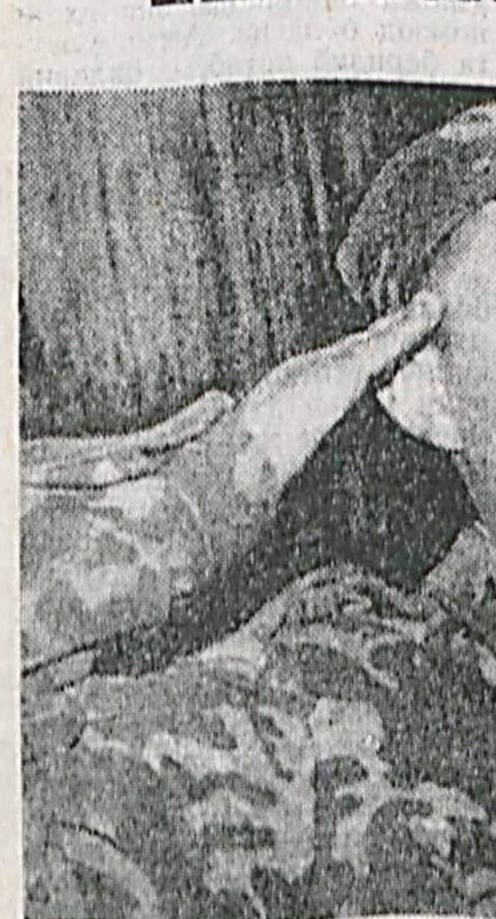
(Давом. Боши 1-бетда).