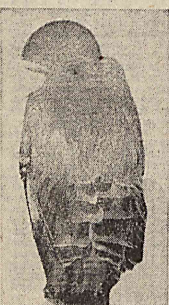
гизалик танловига тайёргарлик қўради. Макнённинг ўзи жуҷаларни воғра етказишга мажбур.

Амазонканингр тропик ўрмонларида қўнчиликка номатдун бир қуш бор. Уни ёғду соҳаётдан шар, оловли комета ва яна бир қанча таърифу тасвиф билан аташган. Ушбу жозибали қўнчани қўриғилар бехосдан шеър ёзиб юбориши, илҳомланиши ҳам эҳтимолдан ҳоли эмас. Табиатнинг бу гўзал жонзоти қаптардек катталида бўлиб, қон хўрозни дейилади.