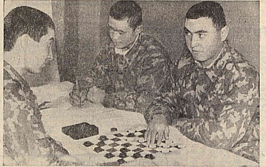
С. ТОЛМАСОВ тайёрлади.