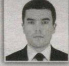
116 – Navbahor saylov okrugi