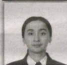
69 – Toyloq saylov okrugi