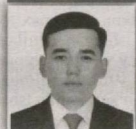
41 – Xatirchi saylov okrugi