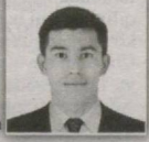
104 – Uchko'prik saylov okrugi