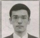
17 – Qo'rg'ontepa saylov okrugi