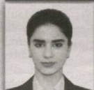
28 – Poykent saylov okrugi