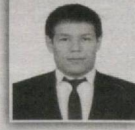
119 – Gurlan saylov okrugi