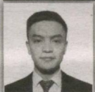
61 – Qo'shrabot saylov okrugi