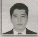
93 – Parkent saylov okrugi