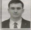
72 – Guliston saylov okrugi