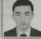
146 – Astrobod saylov okrugi