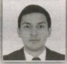
77 – Angor saylov okrugi