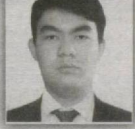
142 – Qoraqamish saylov okrugi