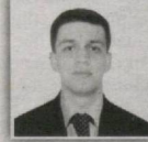
127 – Qarshi saylov okrugi