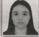
81 – Qumqo'rg'on saylov okrugi