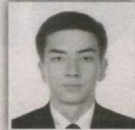
13 – Asaka saylov okrugi