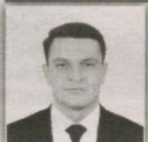
36 – Paxtakor saylov okrugi