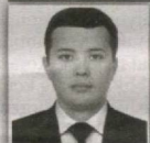
62 – Ishtixon saylov okrugi