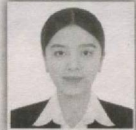
11 – Bo'z saylov okrugi