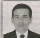
27 – Varaxsho saylov okrugi