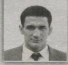
130 – Kasbi saylov okrugi