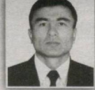
125 – Qamashi saylov okrugi