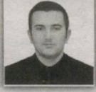
115 – Quvasoy saylov okrugi