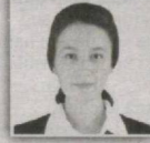
111 – Farg'ona saylov okrugi