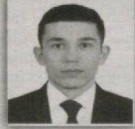
122 – Xiva saylov okrugi