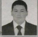
124 – Qo'shko'pir saylov okrugi