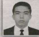
88 – Bekobod saylov okrugi