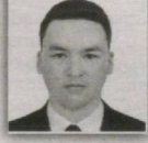
113 – Toshloq saylov okrugi