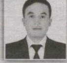
109 – Qo'shtepa saylov okrugi