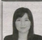
42 – Nurota saylov okrugi