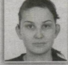
144 – Dombirobod saylov okrugi