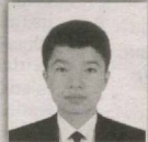
15 – Xo'jaobod saylov okrugi