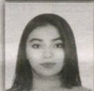
47 – Pop saylov okrugi