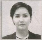
1 – Nukus saylov okrugi

Xabaringiz bor joriy yilning yanvar-fevral oylarida O'zbekiston Respublikasi Oliy Majlisi Qonunchilik palatasi huzuridagi Yoshlar parlamenti a'zolari uchun saylov o'tkazildi. Ikki bosqichda o'tkazilgan Saylovda jami 1273 nafar yoshlardan hujjatlar kelib tushdi hamda hududiy tashkiliy qo'mitalarning saralash bosqichi xulosalariga ko'ra jami 346 nafar saralangan nomzodlar ro'yxati Saylov hay'atiga baholash uchun tavsiya etildi. Partiyanning hududiy Kengashlaridagi Saylov hay'atlari tomonidan baholash natijalariga ko'ra jami 108 nafar nomzodlar saylovning Respublika bosqichida ishtirok etishi uchun tavsiya etildi hamda ularning 36 nafari Respublika hay'at a'zolari tomonidan saylandi. Fursatdan foydalanib, partiya jamoasi saylovda faol ishtirok etgan barcha yoshlarga minnatdorlik bildiradi va kelgusida ular bilan aloqalarni mustahkamlashdan manfaatdor ekanligini ma'lum qiladi. «Milliy tiklanish» demokratik partiyasining ko'p ming sonli a'zolari nomidan Yoshlar parlamentiga saylangan barcha yoshlarni tabriklaymiz va ularning faoliyatida omdalar tilaymiz!