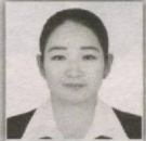
4 – Amudaryo saylov okrugi