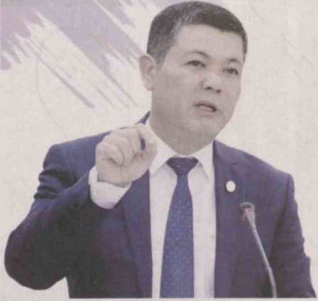
Нодир ТИЛАОЛДИЕВ, Олий Мажлис Қонунчилик палатаси депутати

Қонун устуворлигини таъминлаш, халқ иродаси ва фикри билан ҳисоблашган ҳолда ислохотларни жадаллаштириш, уларнинг ижтимоий, иқтисодий ва сиёсий ҳаётимиздаги ролини оширишда партияларнинг роли жуда муҳим, албатта.