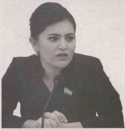
Умида РАҲМОНОВА, Олий Мажлис Қонунчилик палатаси депутаты