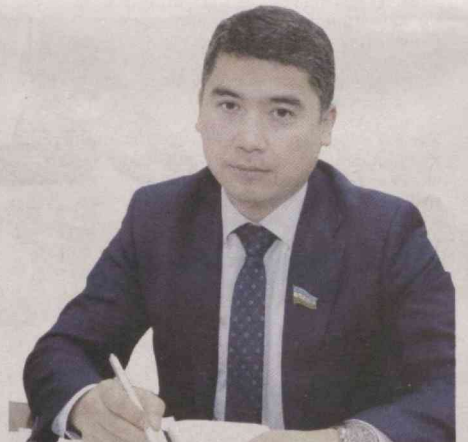
Фарҳод ЗАЙНИЕВ, Олий Мажлис Қонунчилик палатаси депутати

Миллий дастурнинг қабул қилиниши эса таълим ташкилотларида қулай шароитлар яратилишига асос бўлмоқда. Мактабгача ва умумий ўрта таълимда "Тарбия" фанининг киритилиши ҳам маърифатли ёшлар тарбиясида муҳим рол ўйнай бошлади. Янги қилинган Конституцияда эса таълим, тарбия, ахлоқий тарбия билан боғлиқ нормалар оила билан бирга алоҳида бобда баён этилдики, бу ёшларга бўлган эътибордан далолат. Шубҳасиз, маърифатли ёшларни вояга етказишда оила ва маҳалла билан бир қаторда таълим тизимининг ўрни беқиёс. Шу боисдан кейинги йилларда мактабгача таълимга болалар қамрови 23 фоиздан қарийб 90 фоизга етказилди.