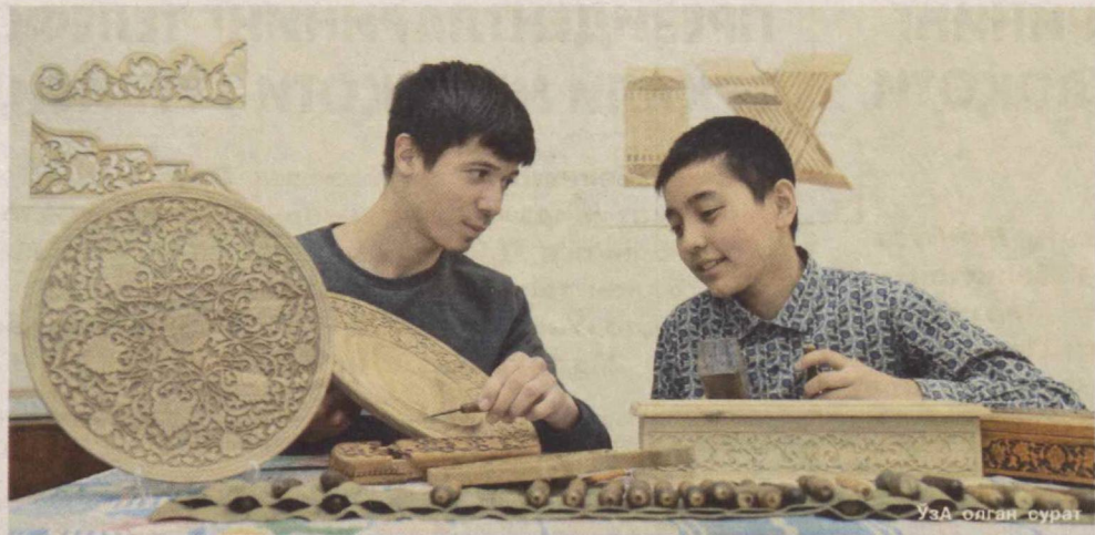
Ўтган йиллар давомида мамлакатимизда беш мингга яқин ҳунарманд ўз устахоналарида “Уста-шогирд” мактаблари ташкил этиб, 12 мингга яқин ёшларга ҳунар сирларини ўргатди.

Тошкент шаҳар Божхона бошқармасида Ўзбекистон Республикаси Президентининг 2017 йил 2 февралдаги “Коррупцияга қарши курашиш тўғрисида”ги Ўзбекистон Республикаси Қонунининг қондаларини амалга ошириш чора-тадбирлари тўғрисида”ги Қарори билан тасдиқланган 2017-2018 йилларга мўлжалланган коррупцияга қарши курашиш бўйича Давлат дастури ижроси доирасида “Очик эшиклар куни” тадбири ўтказилди.