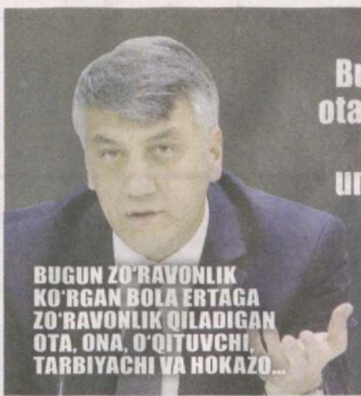
BUGUN ZO'RAVONLIK KO'RGAN BOLA ERTAGA ZO'RAVONLIK QILADIGAN OTA, ONA, O'QITUVCHI, TARBIIYACHI VA HOKAZO...

Bugungi zo'ravon hayotini ona suti bilan boshlamagan, bolaligida ota-onasi, tarbiyachi yoki o'qituvchisining agressiv munosabatiga duch kelgan inson aslida. Bolaga qanday munosabatda bo'lsak, unga qanday tarbiya bersak, shunday kelajak yasaymiz. Bolalarni zo'ravonlikdan himoya qilishga qaratilgan juda muhim qonun loyihasini birinchi o'qishda tasdiqladik. Ikkinchi o'qishda qonunning ta'sirchanligi va samaradorligini ta'minlashga qaratilgan ko'pgina takliflarimiz bor.