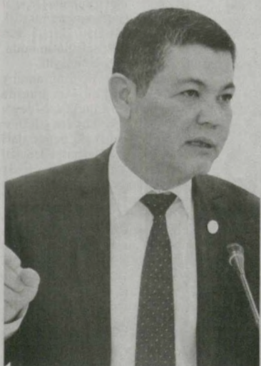
Nodir TILAVOLDIYEV, Oliy Majlis Qonunchilik palatasi deputati

Bundan bir necha yillar avval yoshlarimiz uchun xorijda o'qish yoki ishlash ushulmas orzu bo'lib tuyulardi. Mamlakatimizda olib borilayotgan izchil islohotlar tufayli chet elda ta'lim olayotgan va mehnat faoliyatini olib borayotgan yigit-qizlarimiz safi yildan-yilga kengaymoqda.