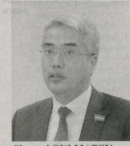
Sherzod QULMATOV, Oliy Majlis Qonunchilik palatasi deputati

Ushbu sa'y-harakatlardan ko'zlangan maqsad bitta: toki chet ellarda mehnat qilayotgan yoshlarimiz hech bir to'siq yoki muammoga duch kelmasin, vatqingiz, oilasi bag'riga sog'-omon qaytsin.