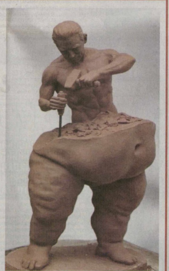
Ўзимни ўзим ўзгартиришим керак...