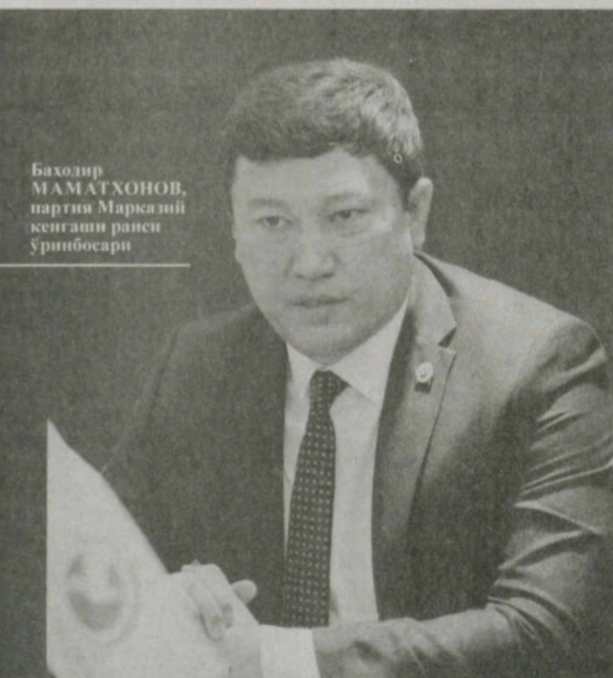
Баҳодир МАМАТҲОНОВ, партия Марказий кенгаши раиси ўринбосари